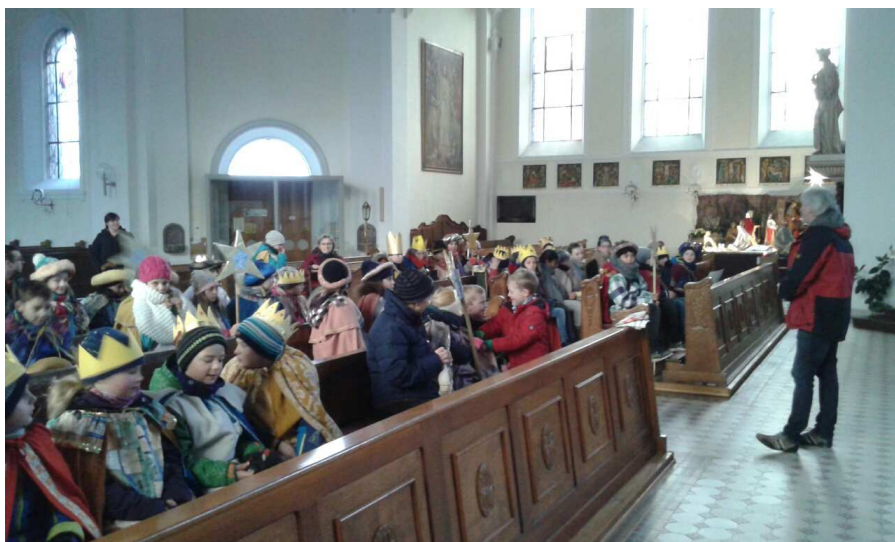
Sternsinger Siersburg vor der Aussendung

Dafür möchten wir Dankeschön sagen, allen Spendern für ihre Großzügigkeit und dafür, dass sie die Kinder herzlich empfangen haben. Dankeschön allen, die die Aktion vorbereitet haben, die Sternsinger auf ihrem Weg begleitet oder ihnen in irgendeiner Weise etwas Gutes getan haben. Das größte Dankeschön gilt natürlich unseren Kindern, die sich an diesem kalten Tag auf den Weg gemacht haben, um sich für andere Menschen auf dieser Welt einzusetzen, ein soziales Engagement, das unseren Respekt verdient.