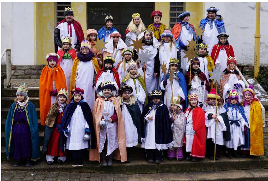
Sternsinger aus Hemmersdorf vor der Pfarrkirche St. Konrad