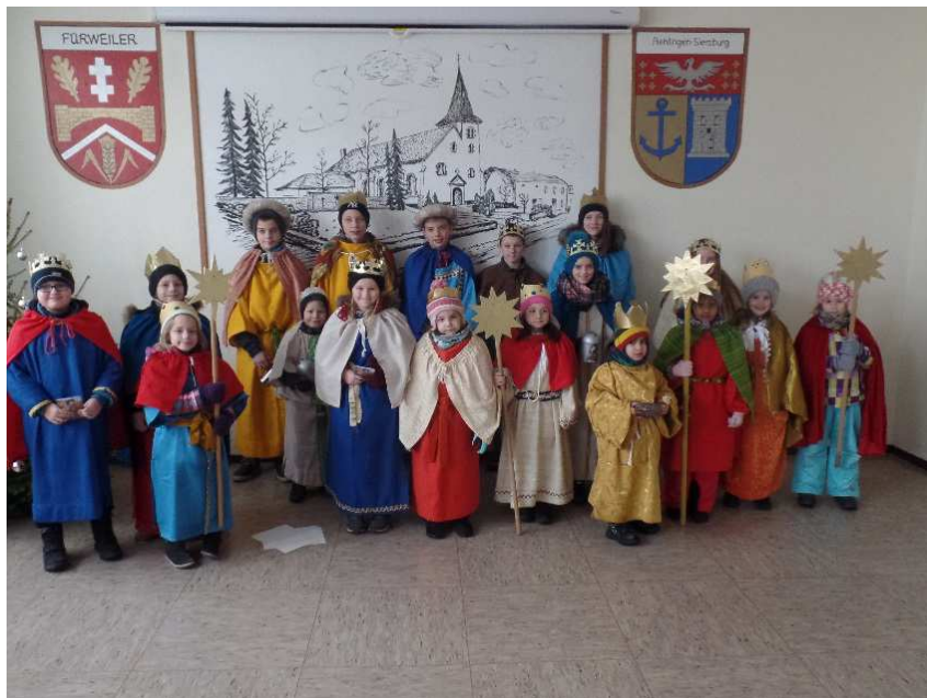
Sternsinger aus Fürweiler

Bei widrigen Wetterverhältnissen machten sich am 8. Januar 2017 18 Sternsinger auf den Weg durch den Ort. Die diesjährige Aktion stand unter dem Motto "Gemeinsam für Gottes Schöpfung - in Kenia und weltweit". Diesmal geht es um den Klimawandel und was er zum Beispiel in der Turkana verursacht. Die Familien dort haben nichts zum Klimawandel beigetragen, müssen aber mit den schlimmen Folgen leben. Die Sternsinger helfen vor Ort. Es konnte die beachtliche Summe von 763,- € gesammelt werden. Nach der Aktion konnten sich die Sternsinger bei Pizza und Süßigkeiten stärken. Vielen Dank an alle Sternsinger und allen Spendern für das sehr gute Ergebnis. Die Aktion wurde von Petra Hans – Marianne Otto – Sandra Püschel – Iris Schütz und Andrea Wirth organisiert und begleitet, auch hier ein herzliches Wort des Dankes!