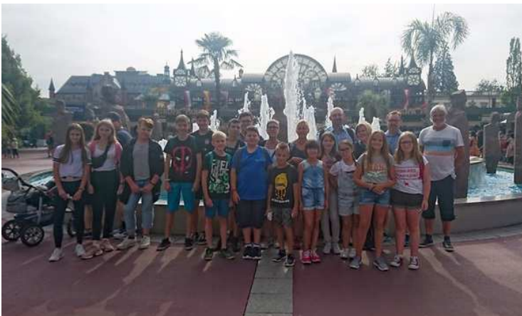
Gruppenfoto der Messdiener mit ihren Begleitern