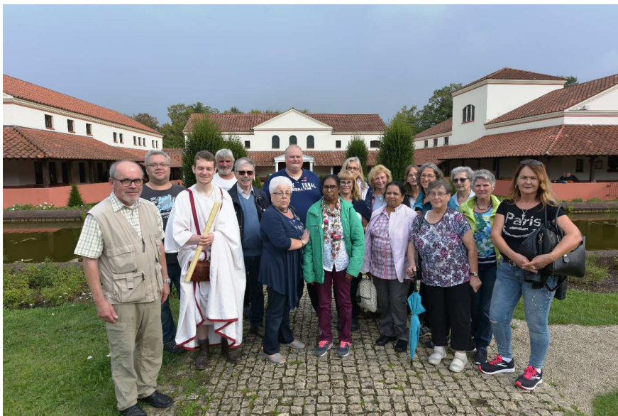
Teilnehmer des Betriebsausflugs