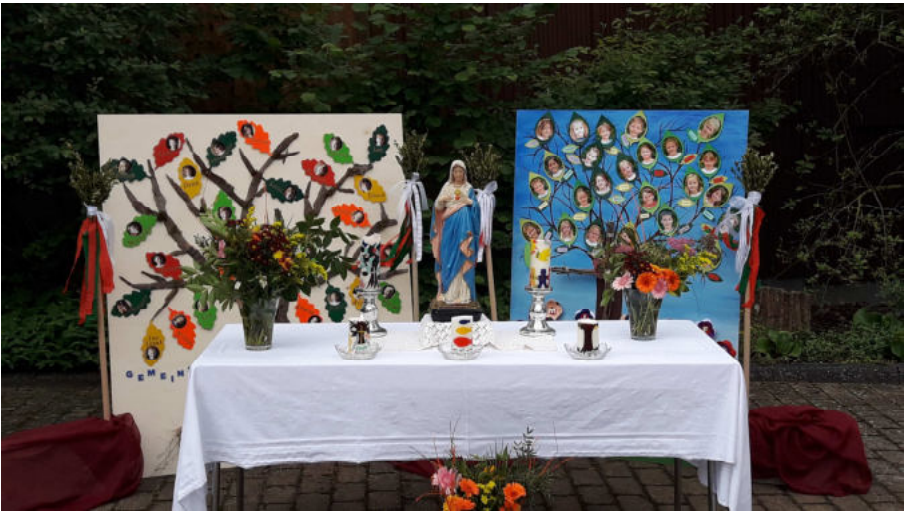
(Altar der Kommunionkinder)