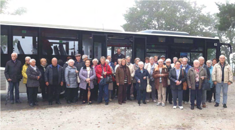
Teilnehmer der Klausenwallfahrt

Am Sonntag, dem 6. Oktober fuhren unsere Senioren/Innen nach Klausen. Abfahrt war um 12.30 Uhr an der Kirche St. Konrad. Nach einer gemütlichen Kaffeepause im Restaurant-Café-Hotel Zummethof fuhren alle um 16.00 Uhr weiter nach Klausen. Gegen 16.30 Uhr wurden die Fußpilger dort empfangen und um 17.00 Uhr feierten alle die Pilgermesse. Alle Teilnehmer der Klausenwallfahrt waren sehr begeistert und wollen auch im nächsten Jahr diese Fahrt wiederholen.