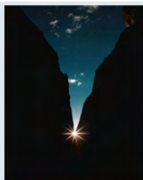
Fürchtet euch nicht! Ökumenisches Gebet im Advent

Mittwoch, dem 18. Dezember, um 18.00 Uhr , das Friedenslicht an den Häusern Schaaf (In Silven 24) und Dittgen (In Silven 27) in Empfang nehmen und damit unsere eigenen Kerzen und Laternen entzünden. Vor Ort können Friedenslichtkerzen käuflich erworben werden. Nach einer kurzen Statio ziehen wir in einer Lichterprozession zur Kirche und feiern dort – nur bei Kerzenschein – eine adventliche Lichtermesse. Bei unzumutbaren Wetterverhältnissen (Dauerregen, Sturm) findet die Statio direkt in der Kirche statt. Bei Glatteis fällt der Gottesdienst und die Prozession aus. Die Friedenslichtaktion entstand ursprünglich aus der Pfadfinderbewegung und soll das gemeinsame Gebet für den Weltfrieden unterstützen. In der Geburtsgrötte in Bethlehem wird dieses Licht jedes Jahr entzündet und kommt dann im Flugzeug nach Deutschland. Im Bistum Trier wird es u.a. in einem Gottesdienst am 3. Advent empfangen und von dort in die Dekanate und Gemeinden gebracht.