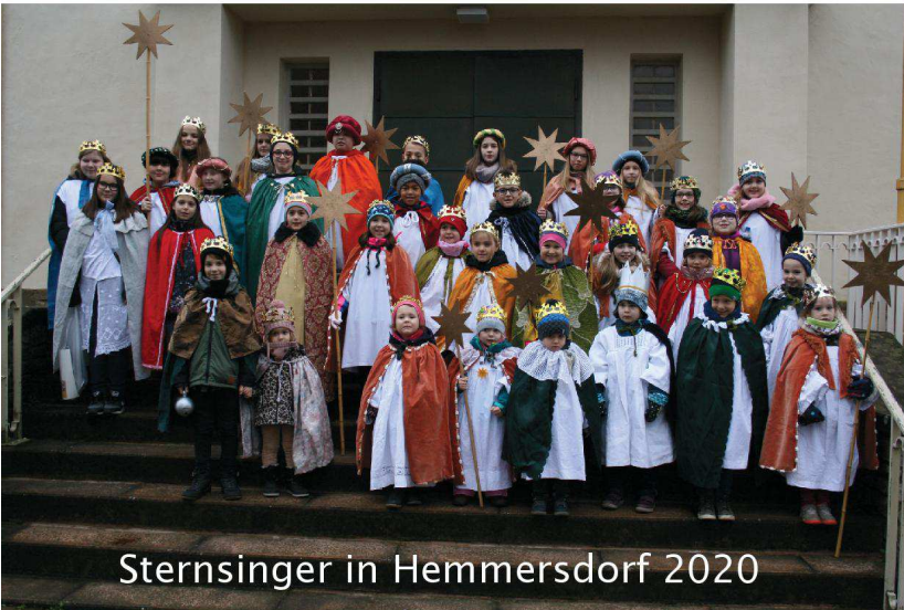
Sternsinger in Hemmersdorf 2020

Für die Kinder in Hemmersdorf und Fürweiler war die Sternsingeraktion ein tolles Erlebnis, da waren sich die Sternsinger alle einig. Am 4. Januar um 09.30 Uhr gingen insgesamt 35 Mädchen und Jungen im Alter von 3 bis 13 Jahren in Hemmersdorf von Haus zu Haus und in Fürweiler am 5. Januar, um die Häuser zu