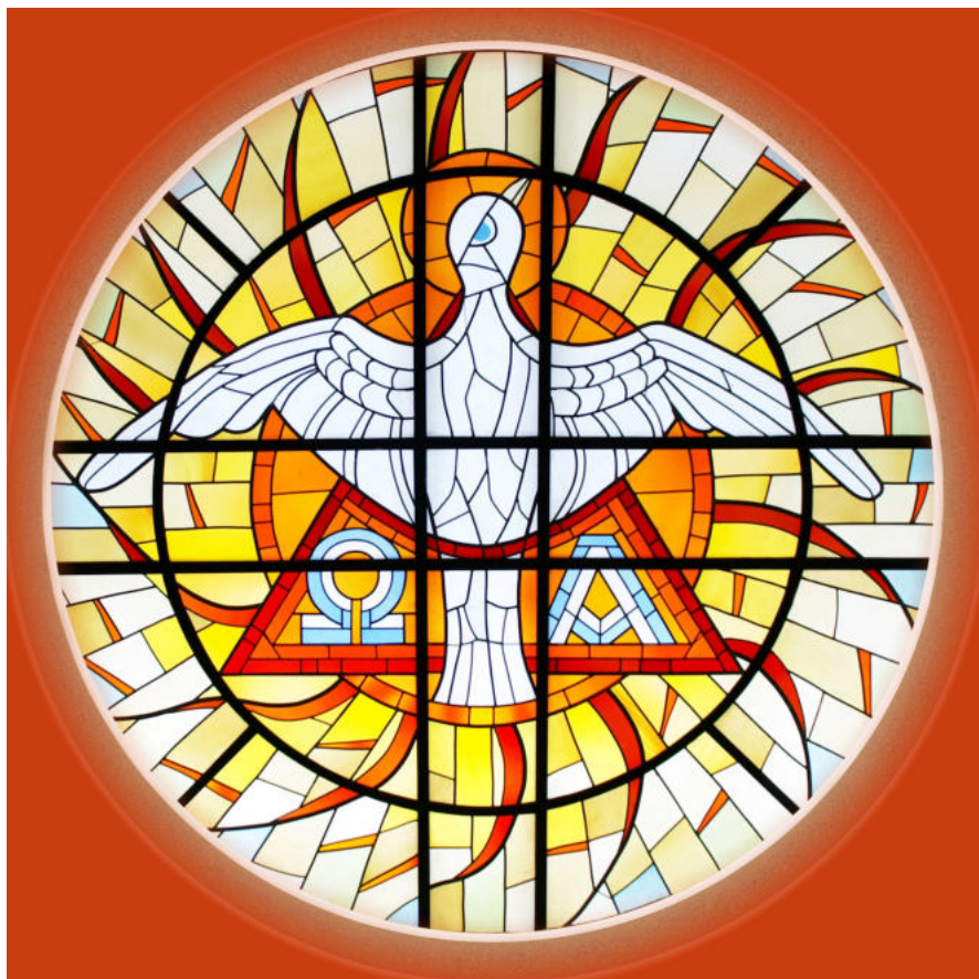
Bild: Foto: Martin Manigatterer / Kunst: Glaswerkstätten im Stift Schlierbach / Standort: Fatimakapelle Schardenberg In: Pfarrbriefservice.de