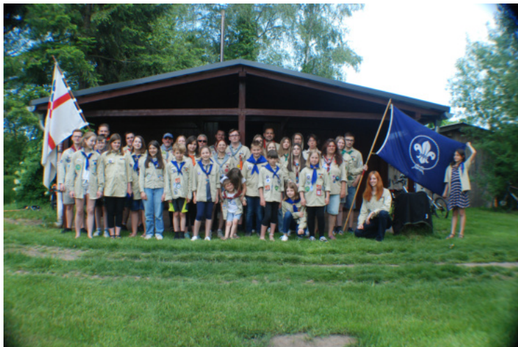
Deutsche Pfadfinderschaft Stamm St. Nikolaus Rehlingen