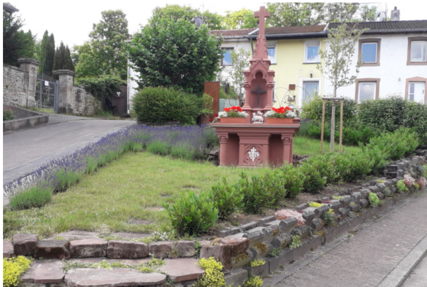
Altar am Friedhof

Wenn auch keine Prozession stattfand, so war es doch eine Freude auf einem Spaziergang dort innezuhalten.