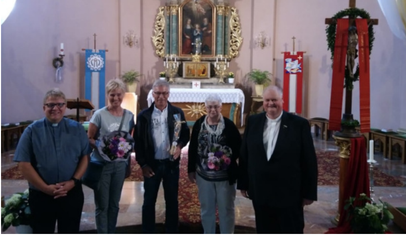
Auf dem Foto fehlt Nick Schellenbach