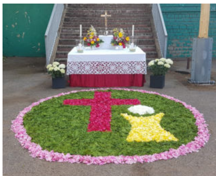
Altar des PGR Biringen