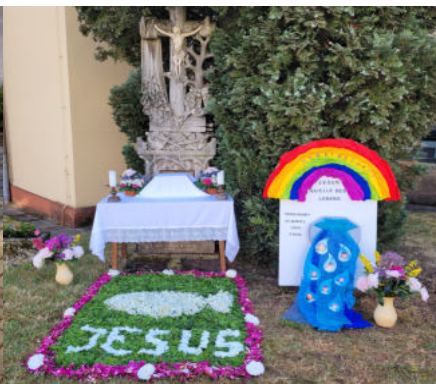
Altar der Kommunionkinder