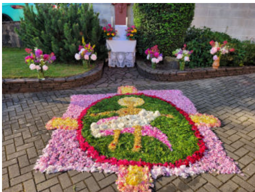
Altar des PGR Gerlfangen