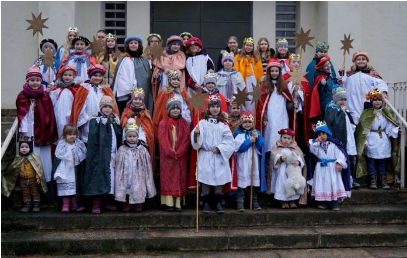
Sternsinger in Hemmersdorf

Wir möchten herzlich allen danken, die zum Gelingen dieser tollen und wichtigen Aktion beigetragen haben.