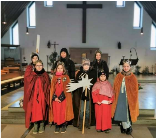
Sternsinger in Oberesch

Ein herzliches Dankeschön an alle Kinder und Jugendliche und ihre Betreuerinnen und Betreuer, die in Biringen und Oberesch dafür sorgten, dass der Segen in alle Häuser gebracht wurde. Die insgesamt 18 Sternsinger sammelten über 1.400,00 € zur Unterstützung der diesjährigen Sternsingeraktion. Danke auch an alle Spender.