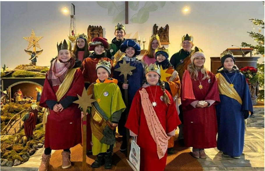
Sternsinger in Gerlfangen

Ein herzliches Dankeschön an alle, die mitgemacht haben, die Betreuerinnen, die Eltern und an alle, die „unsere Sternsinger“ herzlich empfangen und mit ihrer Spende unterstützt haben.