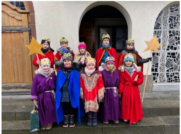
Sternsinger in Biringen