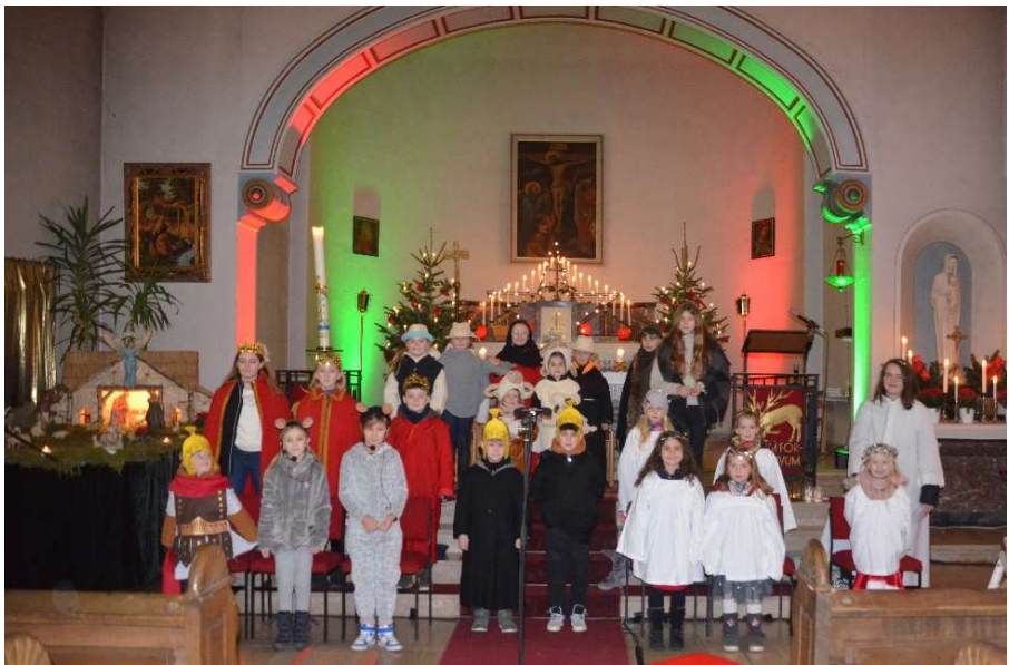
Kinderkrippenfeier in Biringen