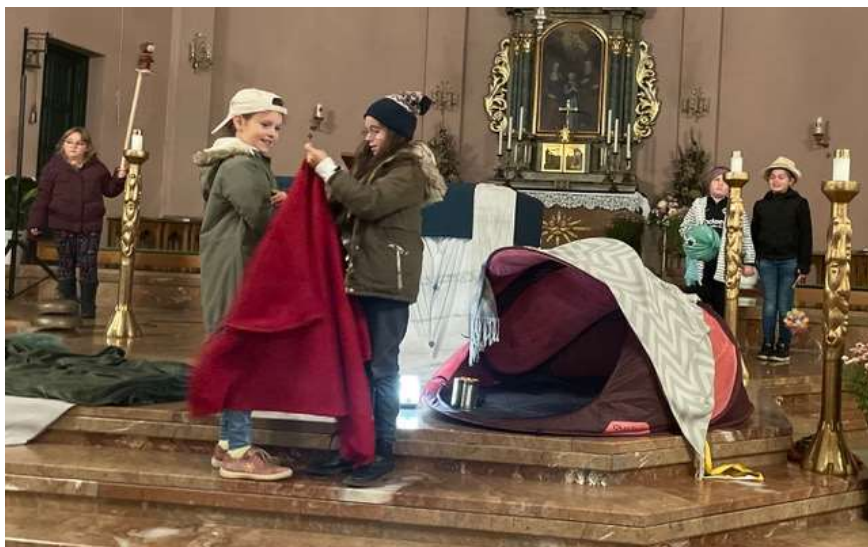
(Rückblick Martinsfeier in St. Konrad)