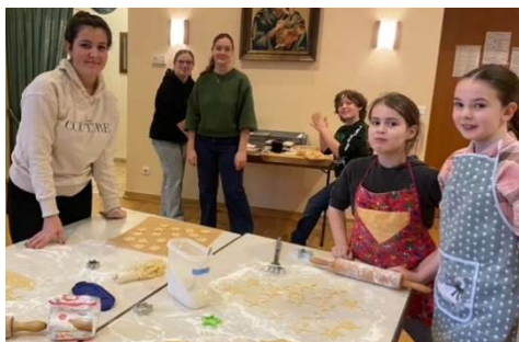
Die Messdienerinnen und Messdiener beim Plätzchenbacken

Am dritten Adventsonntag, dem 15. Dezember 2024 hatten die Messdienerinnen und Messdiener aus Hemmersdorf zusammen mit ihren Betreuerinnen viel Spaß beim gemeinsamen Plätzchenbacken im Pfarrheim.