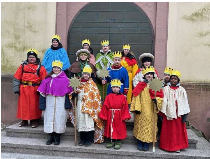
Sternsinger in Fürweiler

Auch in Fürweiler waren insgesamt 14 Mädchen und Jungen als Sternsinger an diesem Samstag unterwegs und haben für die gute Sache insgesamt € 810,-- an den Türen gesammelt. Im Anschluss an die Aktion konnten bei einem Pizza – Imbiss neue Kräfte getankt werden, am Abend wurden sie zusammen mit den Sternsinger aus Hemmersdorf im Gottesdienst gebührend empfangen. Vielen Dank an die Kids für das Engagement und natürlich auch an die Spender in Fürweiler.