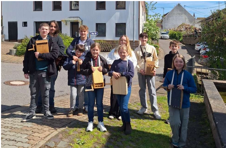
Klepperkinder in Eimersdorf