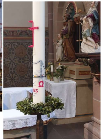
Osterkerze in St. Mauritius 2025 „Mit Jesus eine Brücke bauen“